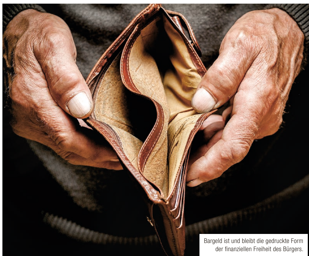
Bargeld ist und bleibt die gedruckte Form der finanziellen Freiheit des Bürgers.

Ein einziges Argument könnte den Abschaffungs-Befürwortern in ferner Zukunft einmal recht geben: Die immer weiter verbreiteten bargeldlosen Zahlungsmittel relativieren den Bargeldverkehr ohnehin zunehmend. In Schweden sind heute bereits 95 Prozent aller Transaktionen digitaler Natur. Auch der Vormarsch digitaler Währungen wie Bitcoin könnte dem Bargeld den Rang ablaufen. Digitales Geld kann allerdings –